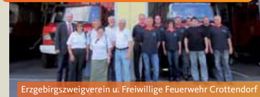
Erzgebirgszweigverein u. Freiwillige Feuerwehr Crottendorf