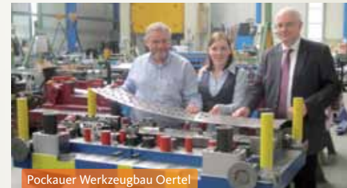
Pockauer Werkzeugbau Oertel