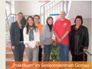
„Praktikum“ im Seniorenzentrum Gornau