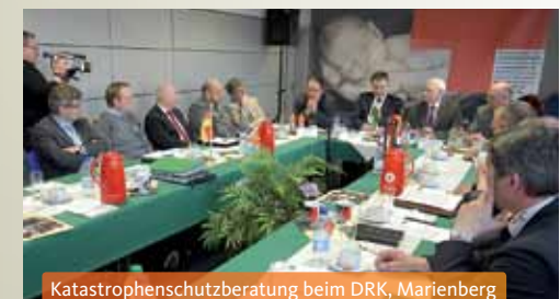
Katastrophenschutzberatung beim DRK, Marienberg