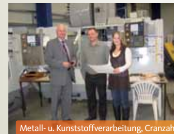
Metall- u. Kunststoffverarbeitung, Cranzahl