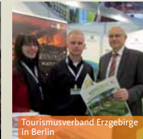
Tourismusverband Erzgebirge in Berlin