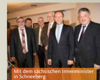
Mit dem sächsischen Innenminister in Schneeberg