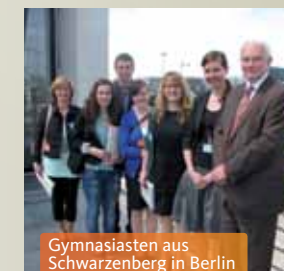
Gymnasiasten aus Schwarzenberg in Berlin