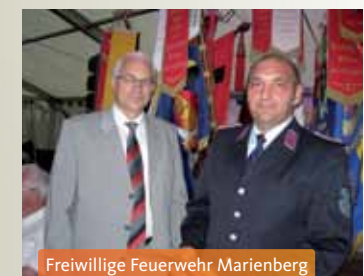
Freiwillige Feuerwehr Marienberg