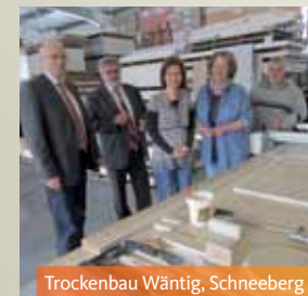
Trockenbau Wäntig, Schneeberg