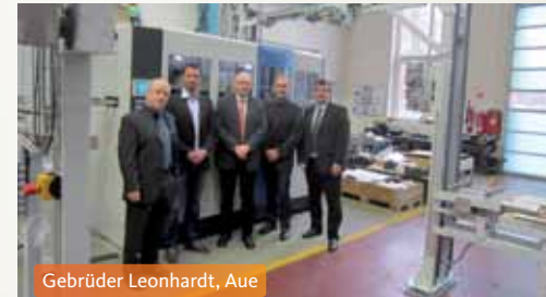
Gebrüder Leonhardt, Aue