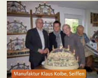
Manufaktur Klaus Kolbe, Seiffen