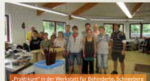
„Praktikum“ in der Werkstatt für Behinderte, Schneeberg