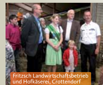
Fritzsch Landwirtschaftsbetrieb und Hofkäserei, Crottendorf