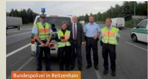
Bundespolizei in Reitzenhain