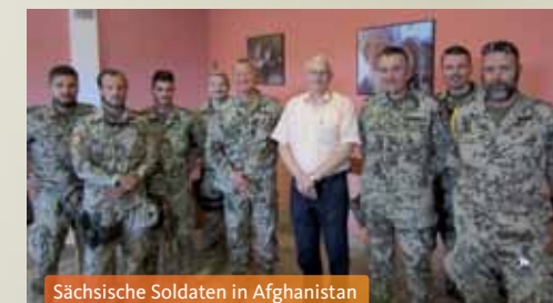
Sächsische Soldaten in Afghanistan