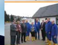
▲ ... bei der Bergsicherung in Schneeberg