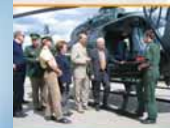
◀ ... beim BGS in Oberwiesenthal