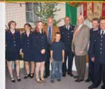
▶ ... bei der Feuerwehr in Wiesa