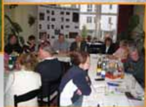
▲ ... mit Bergbrüdern im Kloster Ossek