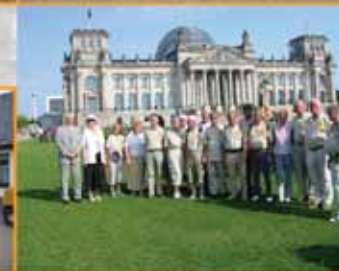
◀ ... mit der Wimpel- wander- gruppe des EZV in Berlin