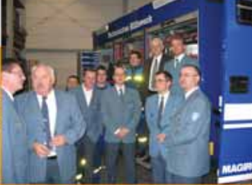
▼ ... bei der Polizei