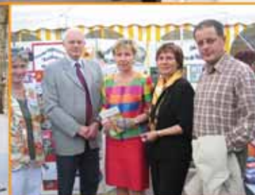
▶ ... am Familientag auf dem Annaberger Markt