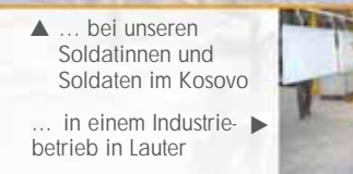
▶ ... in einem Industrie- betrieb in Lauter