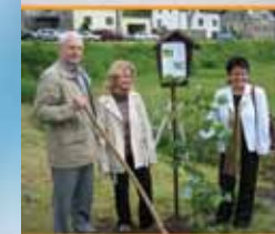
▲ ... beim Landschafts- pflegeverband in Stützengrün