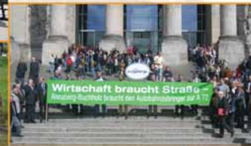
▼ ... in Berlin bei der Demonstration für erzgebirgische Verkehrsanbindung