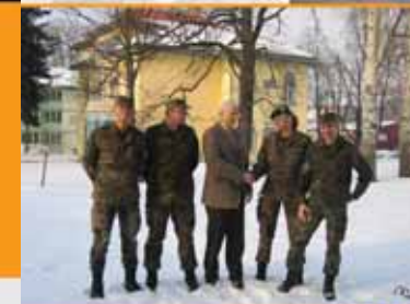
▲ ... bei unseren Soldatinnen und Soldaten im Kosovo